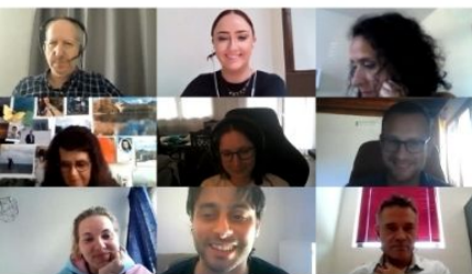
Auftakttreffen, Juni 2021

Aufgrund von COVID-19-Einschränkungen fanden unsere ersten 2 transnationalen Projekttreffen online statt. Unser erstes persönliches Treffen fand diesen April im wunderschönen Rom, Italien, statt!