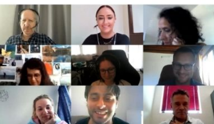
Pirmā tikšanās 2021. gada jūnijs

Covid-19 ierobežojumu dēļ mūsu pirmās divas starptautiskās projekta partneru tikšanās notika tiešsaistē. Mūsu pirmā tikšanās klātienē notika šī gada aprīlī skaistajā Romā, Itālijā!