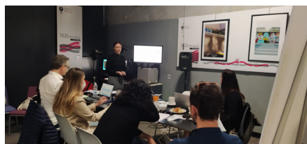
Tercera RIP, abril 2022 (Reunión Internacional de Proyecto)